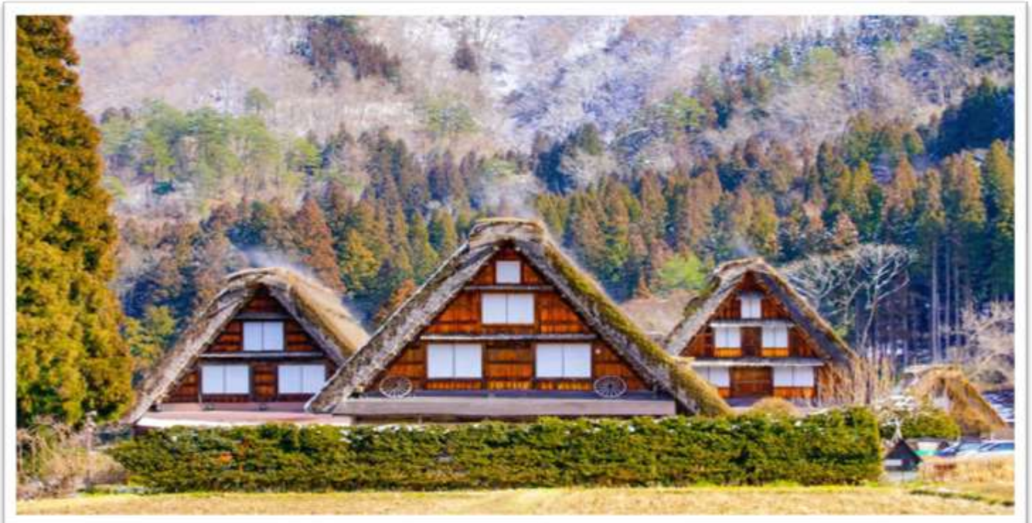
รูปประทานอาหารกลางวัน ณ ภัตตาคาร

นำท่านนำท่านสู่ ชิราคาวาโกะ (SHIRAKAWAGO) เมืองที่เป็นมรดกโลกทางวัฒนธรรมของประเทศญี่ปุ่น เป็นหมู่บ้านชาวนาที่มีรูปร่างแปลกตาติดอันดับ THE MOST BEAUTIFUL VILLAGE IN JAPAN และเป็นเมืองมรดกโลกที่มีชื่อเสียงแห่งหนึ่ง ต่อมาในปี 1995 องค์การยูเนสโกขึ้นทะเบียนให้ชิราคาวาโกะเป็นมรดกโลก