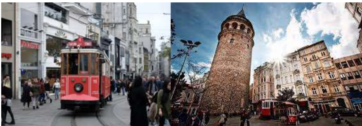
พักค้างคืนที่โรงแรม Crowne Plaza Habiye Hotel 5*

รับประทานอาหารค่ำ ณ ภัตตาคารอาหารพื้นเมือง