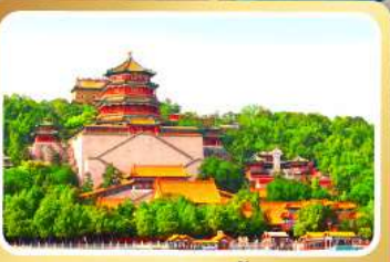
พระราชวังฤดูร้อนอีเหอหยวน