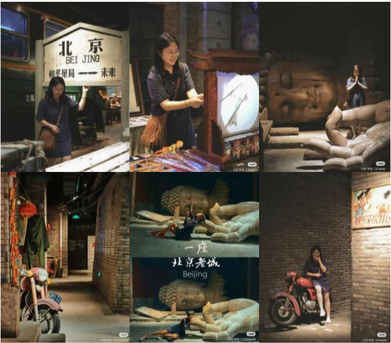
ขอบคุณเจ้าของภาพ (เครดิตตามภาพ)