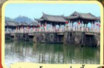
• สะพานโบราณกวางจี้