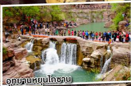
อุทยานหยุ่นโกซ่าน