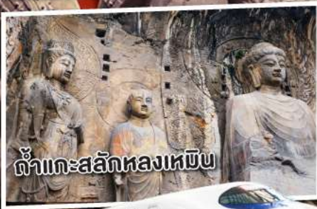
ถ้ำแกะสลักหลงเหมิน