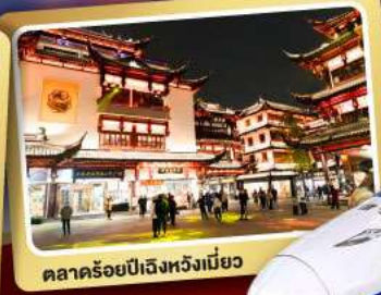
ตลาดร้อยปีเจิ้งหวิงเมี่ยว