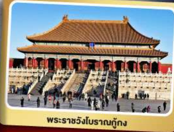
พระราชวังโบราณทุกทั้ง