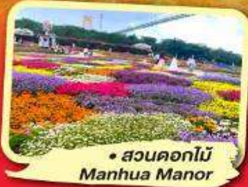
• สวนดอกไม้ Manhua Manor

ไม่ลงร้านซื้อ พักโรงแรม 4-5 ดาว ชมโชว์ริเบต โชว์เปลี่ยนหน้ากาก