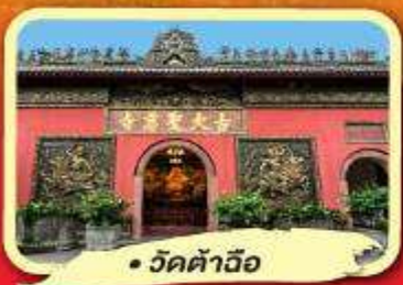
• วัดต้าฉิว