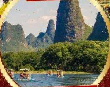
ล่องแพแม่น้ำหลีเจียง