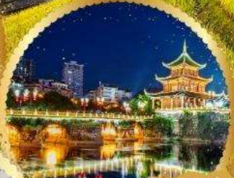
ตึกเซียวเฮยา