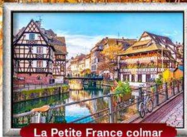
La Petite France colmar

บินหรู สายการบิน Full Service | พิเศษ! หอยแอสคาโก้