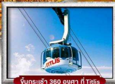
ขึ้นกระเช้า 360 องศา ที่ Titlis