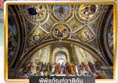
พิพิธภัณฑสถาน