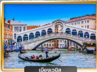
เมืองเวนิส