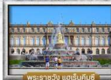
พระราชวัง แฮร์ริคิมชี่