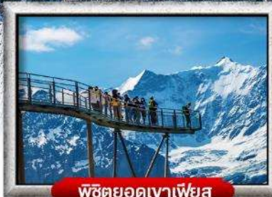
พิชิตยอดเขาเพียส