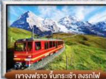
เขา Jungfrau ขึ้นกระเช้า ลงรถไฟ