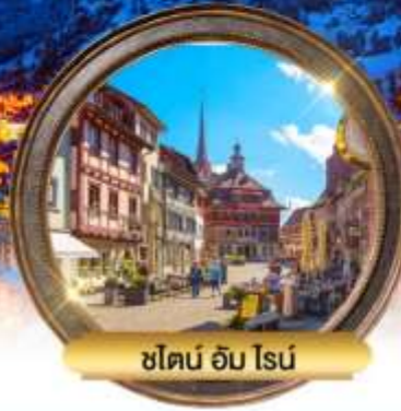
ชิลอน อิม โรน