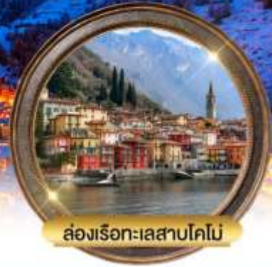
ล่องเรือทะเลสาบโคโม