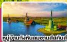
หมู่บ้านกังหันลมชาวนัสคินส์