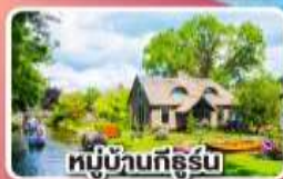
หมู่บ้านที่รัฐัน

พักปารีสและอัมสเตอร์ดัม อย่างละ 2 คืน ไม่ต้องเปลี่ยนโรงแรมบ่อย