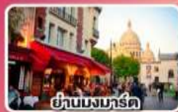
ย่านมงมาร์ต