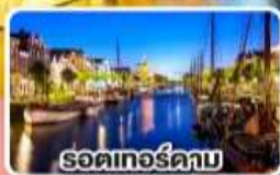
รอดเทอร์ควา