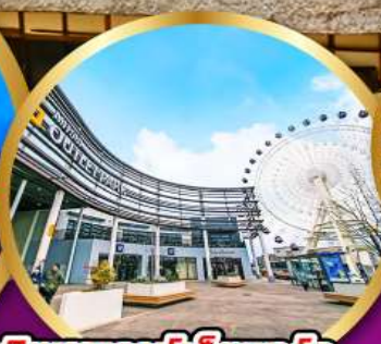
มิตซูฮิเออากะไลท์พาร์ค เซนได