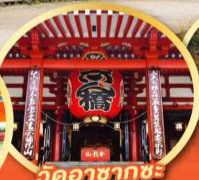
วัดอาซากุซะ