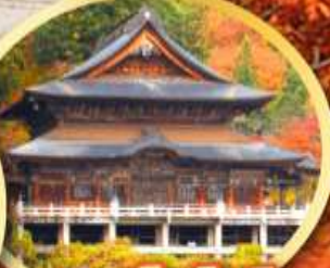
วัดเอ็นโซจิ

กิจกรรมเก็บผลไม้ พักออนเซ็น 2 คืน พักโรงแรมในโตเกียว 2 คืน