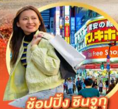
ช้อปปิ้ง ซินจูกุ