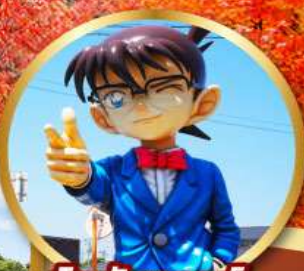
โคนันทาวน์