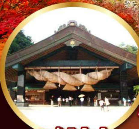
ศาลเจ้าอิชิโมะโทชะ