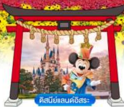
ดิสนีย์แลนด์อิสระ