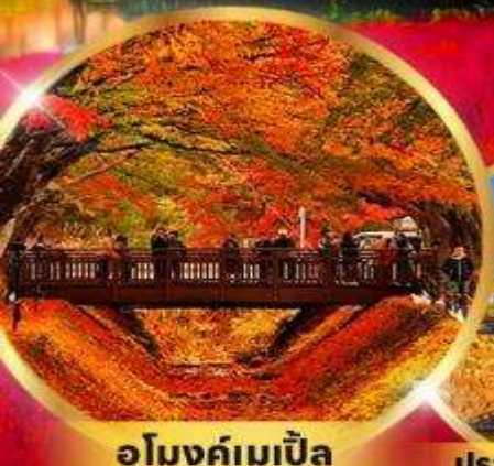
อุโมงค์เมเปิ้ล