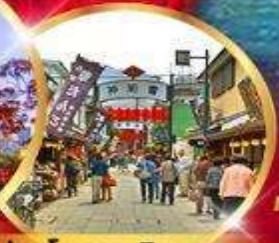
ย่านโบราณ ชิชะมาตะ

ราคา เริ่มต้น 34,919 บาท รวมภาษีมูลค่าเพิ่ม 7%