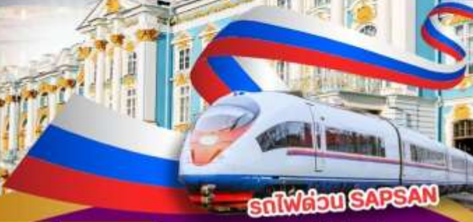
รถไฟความเร็วสูง SAPSAN