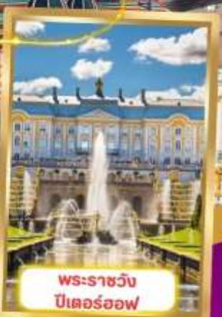
พระราชวัง ปีเตอร์ฮอฟ