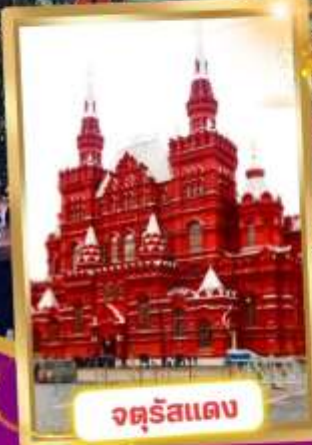
จตุรัสแดง