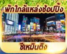
พักใกล้แหล่งช้อปปิ้ง