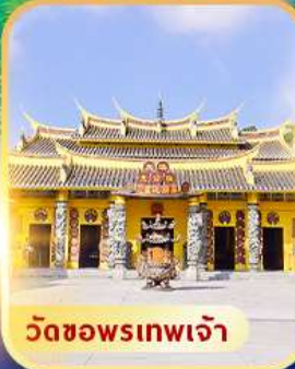
วัดซอพรเทพเจ้า