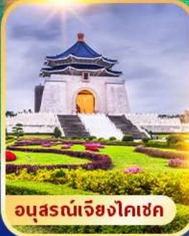
อนุสรณ์เจียงไคเช็ค

ไทเป จิวเฟิน ซีเหมินติง พักซีเหมินติง 2 คืน เที่ยวเต็มไม่มี Free Day