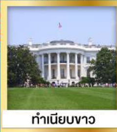
ทำเนียบขาว