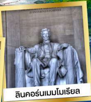
ลินคอล์นเมมโมเรียล