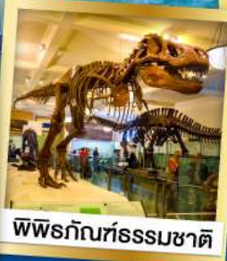
พิพิธภัณฑ์ธรรมชาติ