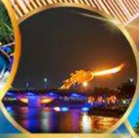
สะพานมังกร