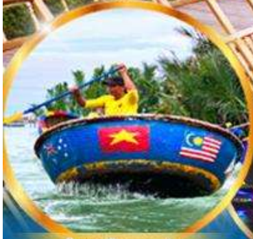
ล่องเรือกระดัง