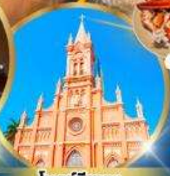
โบสถ์สยามพ