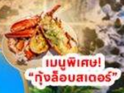
เมนูพิเศษ! "กึ่งลิ้นรสเตอร์"