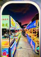
ตลาดอิ๋เหิง