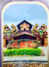
หมู่บ้านชนเผ่า