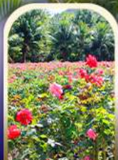
ทุ่งอ่าวยาหลว