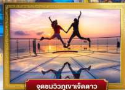
จุดชมวิวกูเงาเจ็ดดาว