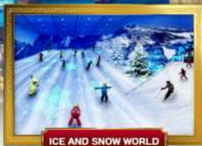
ICE AND SNOW WORLD