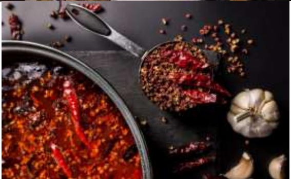
สมควรแก่เวลานำทุกท่านเดินทางสู่ ท่า

Highlight! หม่าล่าเป็นรสชาติยอดนิยมที่ดังมากของจีนที่ หลังทานเครื่องปรุงนี้เข้าไปจะทำให้รู้สึกถึงรสชาติเผ็ดร้อนและซา ซาบซ่าถึงใจ !!