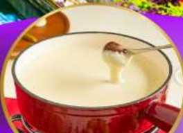
ฟองดูชีส