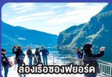
ล่องเรือของฟยอร์ด