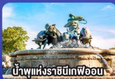
น้ำพุแห่งราชินีเกฟิออน