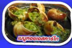
เมนูหอยเสฉกรโท

ทานอาหาร ณ กัิตตารบนหอไอเฟล พร้อมชมวิวแสนโรแมนติก เมนูหอยแมลงภู่อบไวน์ขาว