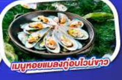
เมนูหอยแมลงภู่อบไวน์ขาว