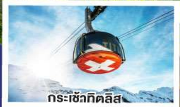
กระเช้าทิดลิส