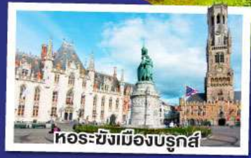
หอระฆังเมืองบรูจส์