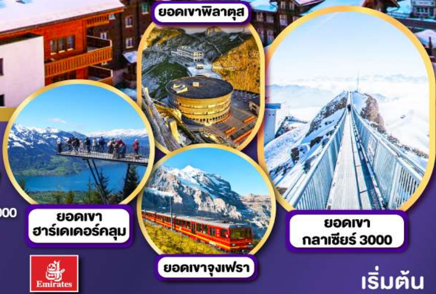
ยอดเขา ฮาร์เดอร์คูลม