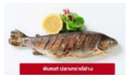
พิเศษ! ปลาเทราต์ย่าง

เที่ยง ๑๑ รับประทานอาหารเที่ยง (มื้อที่6) เมนูพิเศษ ปลาเทราต์ย่างท่านละ 1 ตัว