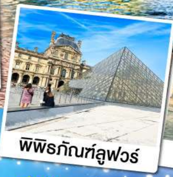
พีพีร์กัทลูฟวร์