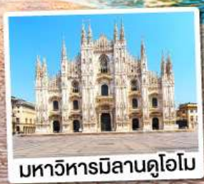
มหาวิหารมิลานดูโอโม