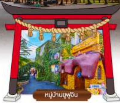
หมู่บ้านยูฟูอิน