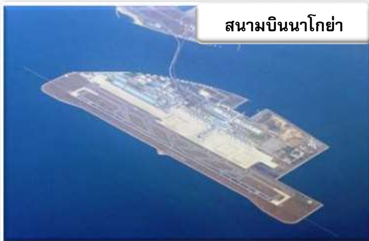
สนามบินนาโกย่า

บริการอาหารร้อนบนเครื่องบินพร้อมกับเมนูผลไม้สดเพื่อเติมเต็มความพิเศษไปพร้อมกับความสดชื่น