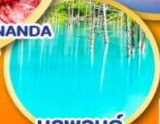
บลูพอนด์ (บ่อน้ำสีฟ้า)

เดินทาง 24-30 ต.ค. 67 31 ต.ค.-06 พ.ย. 67 07-13, 13-19 พ.ย.67