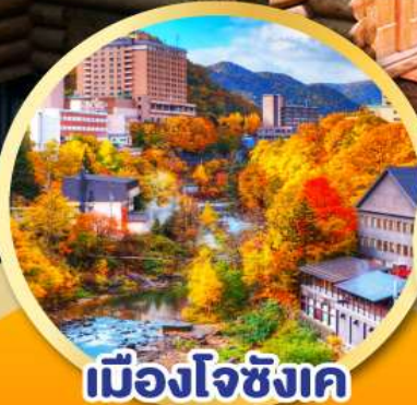
เมืองโจเซ็งค