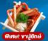
พิเศษ! ชาบูยักษ์