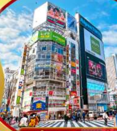
ย่านชินจูกุ