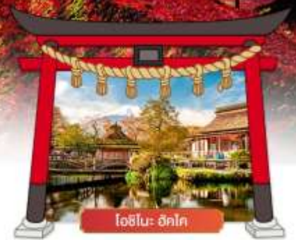
อุโมงค์เมเปิ้ล

เดินทางโดยสายการบิน : ไทยแอร์เอเชียเอ็กซ์