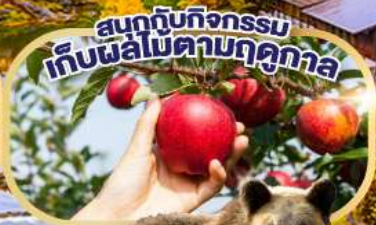
สนุกกับกิจกรรม เก็บผลไม้ตามฤดูกาล