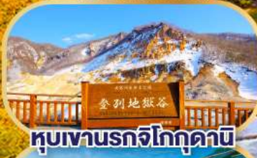
หุบเขานรกจิโกกุคานิ

นั่งกระเช้าชมวิวฮาโกดาเตะ (รวมค่ากระเช้า)