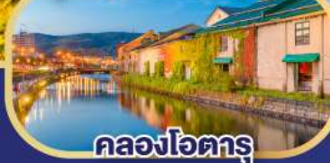
คลองโอดารุ

เที่ยวเต็มทุกวัน ไม่มีฟรีเดย์ ชมใบไม้เปลี่ยนสีหุบเขานรกจิโกกุคานิ