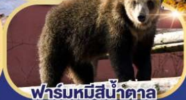
ฟาร์มหมีสีน้ำตาล