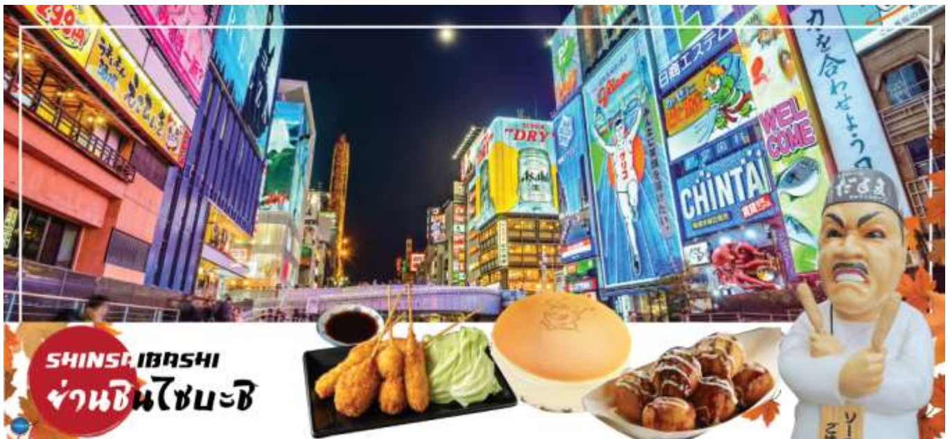
เย็น อิสระรับประทานอาหารเย็นตามอัธยาศัย

จากนั้นอิสระช้อปปิ้ง ย่านชินไซบาชิ (Shinsaibashi) (ใช้เวลาเดินทางประมาณ 1 ชั่วโมง) บริเวณแหล่งช้อปปิ้งแห่งนี้มีความยาวประมาณ 600 เมตร เต็มไปด้วยร้านค้าปลีก ร้านแฟชั่น ร้านเครื่องสำอางค์ ร้านรองเท้า กระเป๋า นาฬิกา ร้านกาแฟ ร้านอาหาร ร้านขนม ร้านเสื้อผ้าสตรีทแบรนด์ทั้งญี่ปุ่นและต่างประเทศ เช่น Zara H&M Beans ABC Mart เป็นต้น เรียกว่ามีทุกอย่างที่ต้องการรวมกันอยู่บริเวณนี้ ใกล้กันท่านสามารถเดินไปยัง ย่านโดทงโบริ (Dotonbori) ย่านบันเทิงยามค่ำ คินดอลอดแนวถนนเลียบบคลองโดทงโบริ จากสะพานโดทงโบริบาชิไปจนถึงสะพานนิปปอนบาชิ ไฮไลท์!!! ใดๆ ก็เช็คอิน ถ่ายภาพคู่ ป้ายกูลิโกะแมน หรือ ป้ายโดทงโบริกูลิโกะ (Dotonbori Glico Sign) เป็นป้ายไฟนีออนรูปนักกรีฑากำลังวิ่งอยู่บนลู่วิ่ง ซึ่งถูกติดตั้งมาตั้งแต่ ปี ค.ศ.1935 นอกจากนี้ยังมีอีกหนึ่งสัญลักษณ์สถานที่นัดพบกันหลง นั่นก็คือ ร้านปูคานิโดราคุ (Kani Doraku) ซึ่งมีปู้ยักซ์ขยับแขนและลูกตาได้อีกด้วย และห้ามพลาดสำหรับ ทาโกะยากิ อาหารท้องถิ่นของชาวโอซาก้า ที่มาถึงถิ่นแล้วต้องลอง Original Taste รับรองไม่ผิดหวังแน่นอน