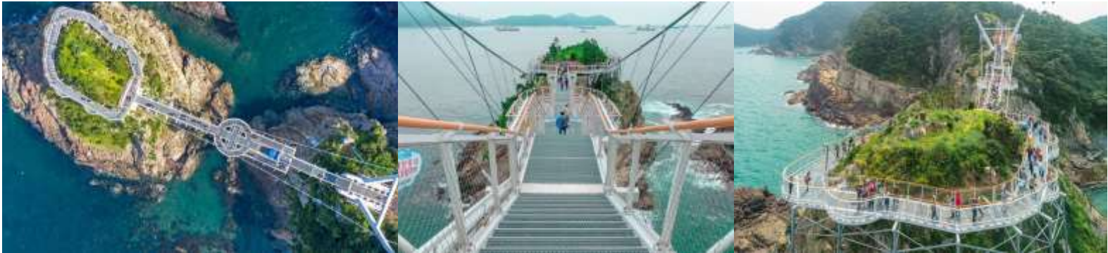
สะพานแห่งนี้

โปรแกรมที่ 5 Songdo Yonggung Cloud Bridge สะพานชมวิวยทะเลปูซาน ที่ถ้าเรามองจากด้านบน ตัวสะพานที่ยื่นออกไปทะเล และ ตีวงล้อมรอบเกาะทงซอม ว่ากันว่ารูปร่างเหมือน lucky key นำพาความโชคดีมาให้กับนักท่องเที่ยวที่มาเดินข้าม