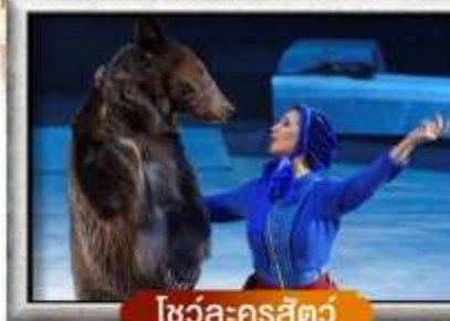
โชว์ละครสัตว์