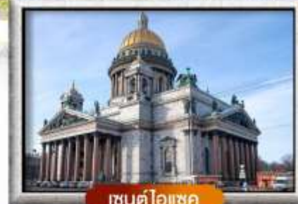
เซนต์ไอแซค