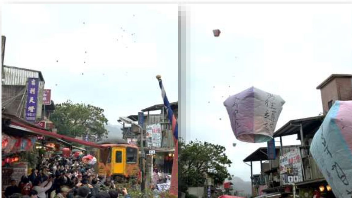
เป็นต้นกำเนิดของ งตรุษจีนด้วย โดย

เช้า รับประทานอาหารเช้า ณ ห้องอาหารของโรงแรม (มื้อที่ 7)