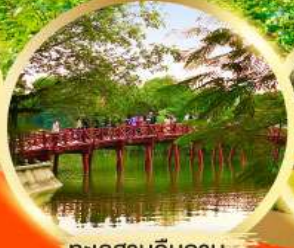
ทะเลสาบคินคาน