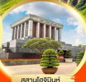
สุสานโฮจิมินห์