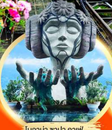
โฮอาน่า ซาปา คาเฟ่