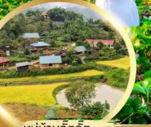
หมู่บ้านกิดกิด