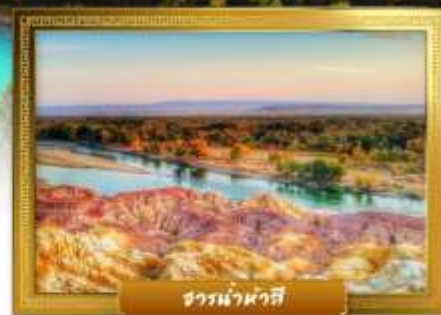
ธารน้ำฟ้าสี