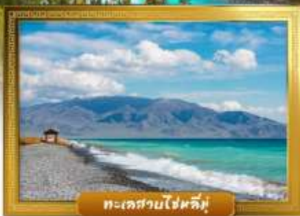
ทะเลสาบโซทลีบู