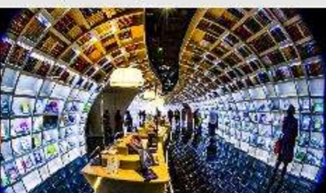
ห้องสมุดก๊วยโจว

*ทางบริษัทฯ ขอสงวนสิทธิ์ในการสืบโปรแกรมทัวร์ตามความเหมาะสมขึ้นอยู่กับสถานการณ์เฉพาะหน้า โดยค่าปีงฟงผลประโยชน์ของลูกค้าเป็นสิ่งสำคัญ