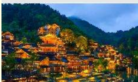
หมู่บ้านวูเจียงจ้าย