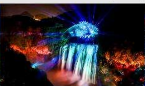
น้ำตกหวงทิวซู