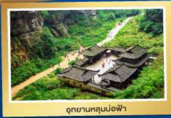
อุทยานหลุนน้อฟ้า