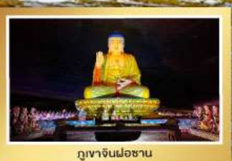
กุฎาจินฝอซาน