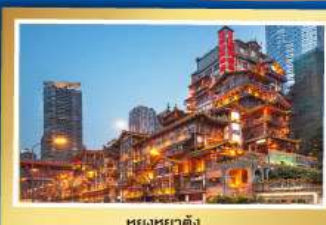
หยงหยาดิง