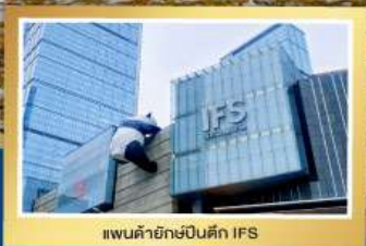
เพนด้ายักษ์ปิ่นดัก IFS