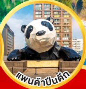
แพนด้าป็นตัก