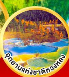
อุทยานแห่งชาติหองหลง