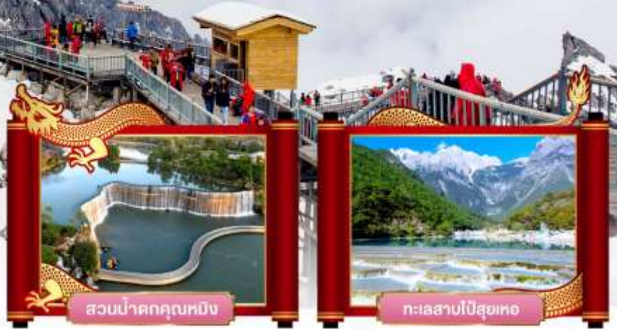
สวนน้ำตกคุนหมิง

พิเศษ! โชว์จางอวี่โทเปว "ความประทับใจลี้เจียง"